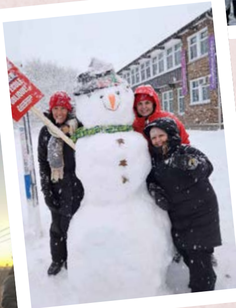
Catégorie «Bonhomme de neige»