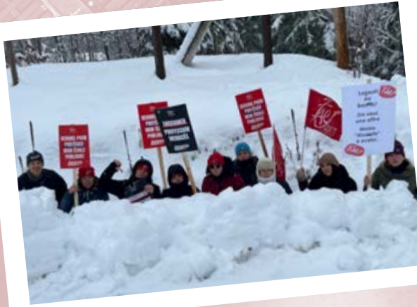
Catégorie «Guerre des tuques»

Nous vous dévoilons aujourd'hui les gagnants!