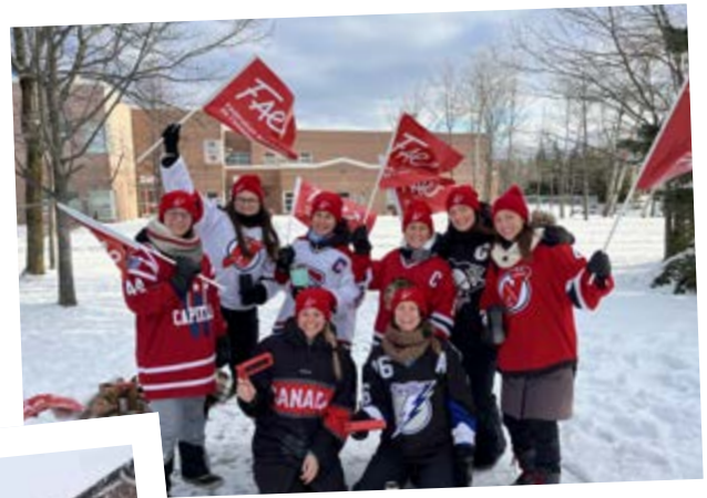
Catégorie «Photo d'équipe»