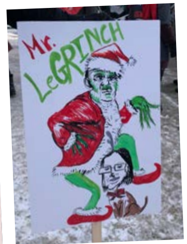
Catégorie «La plus belle pancarte»

Le Grinch (École secondaire Joseph-François Perrault)